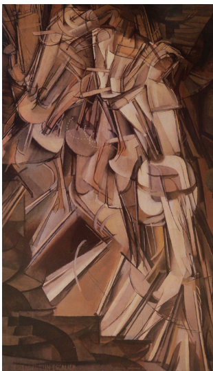
Marcel Duchamp Nu baixant l'escala núm 2 1912

El paisatge documental emfatitza la importància del document com a vehicle de comunicació de l'art d'acció més enllà de l'experiència directa limitada a un lloc i moment precís, reivindicant l'aspecte creatiu del document.