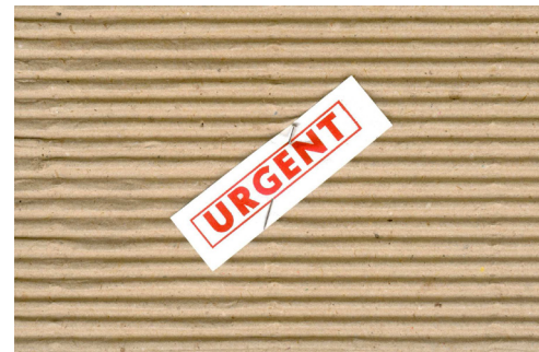
Urgent de J.M. Calleja per el projecte Fluxchamp

Lloc de les conferències: Museu de l'Empordà